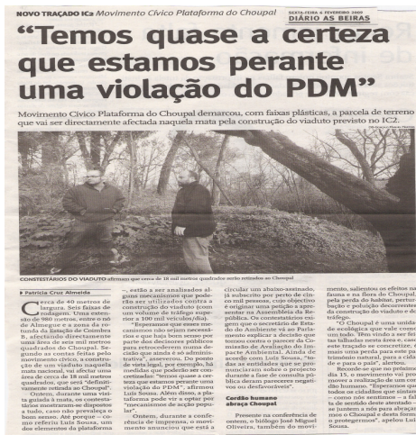
Fig. 3 – Notícia do jornal Diário das Beiras, de 6/2/2009 relativa à construção do viaduto e à Plataforma do Choupal