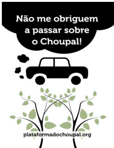
Fig. 1 – Autocolante da campanha de divulgação da contestação à passagem da IC2 sobre o Choupal

d) 48 horas de atividade física no Choupal, que mobilizou diversos clubes e associações desportivas e atletas, mas sem registo oficial do número de participantes.