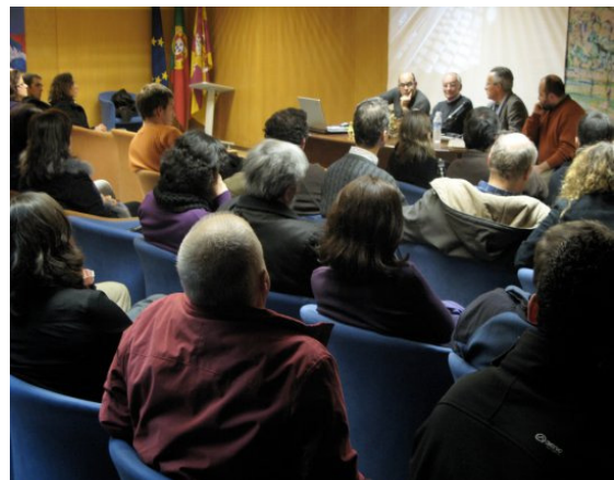
Fig. 4 – Debate sobre a construção do viaduto da IC2 no Choupal