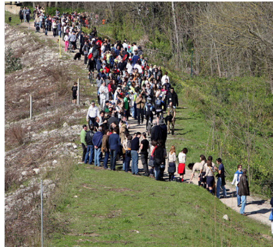
Fig. 2 – Atividade “Abraço ao Choupal”